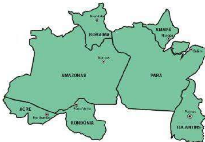
Figura 01. Estados da Região Norte do Brasil

5 - Ações de avaliação: Análises sobre a execução do PDDE e suas Ações Agregadas na região sob a responsabilidade do CECAMPE Região Norte; disseminação das informações sobre o PDDE e suas Ações Agregadas; realização de avaliação sobre o papel do PDDE e suas Ações Agregadas na política de financiamento educacional na região sob a responsabilidade do CECAMPE Região Norte.