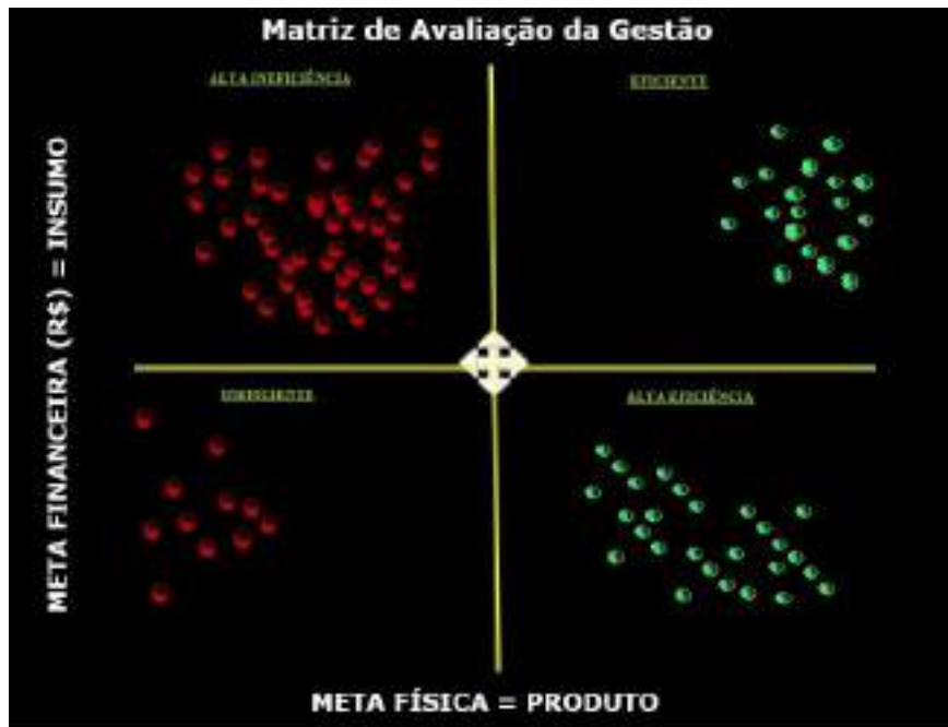
Figura 06: Matriz de Avaliação da Gestão com detalhamento de projeto atividades (ações/atividades)

Realizada. O recorte percentual de aproveitamento se adequa a cronologia e ao ajuste percentual exigido para a classificação, com maior ou menor rigor.