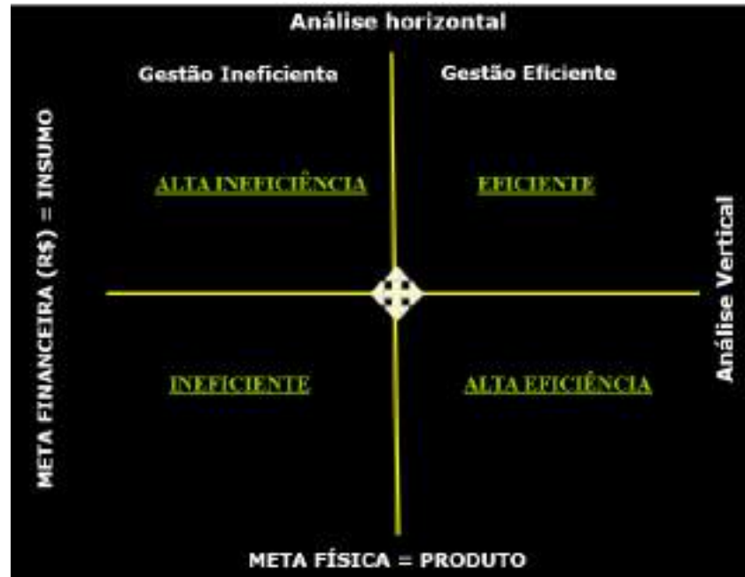
Figura 05: Matriz de Avaliação da Gestão de Programas Institucionais