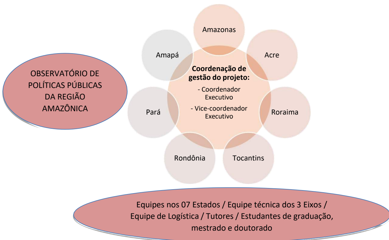
Figura 02. Organograma do Projeto CECAMPE – Região Norte