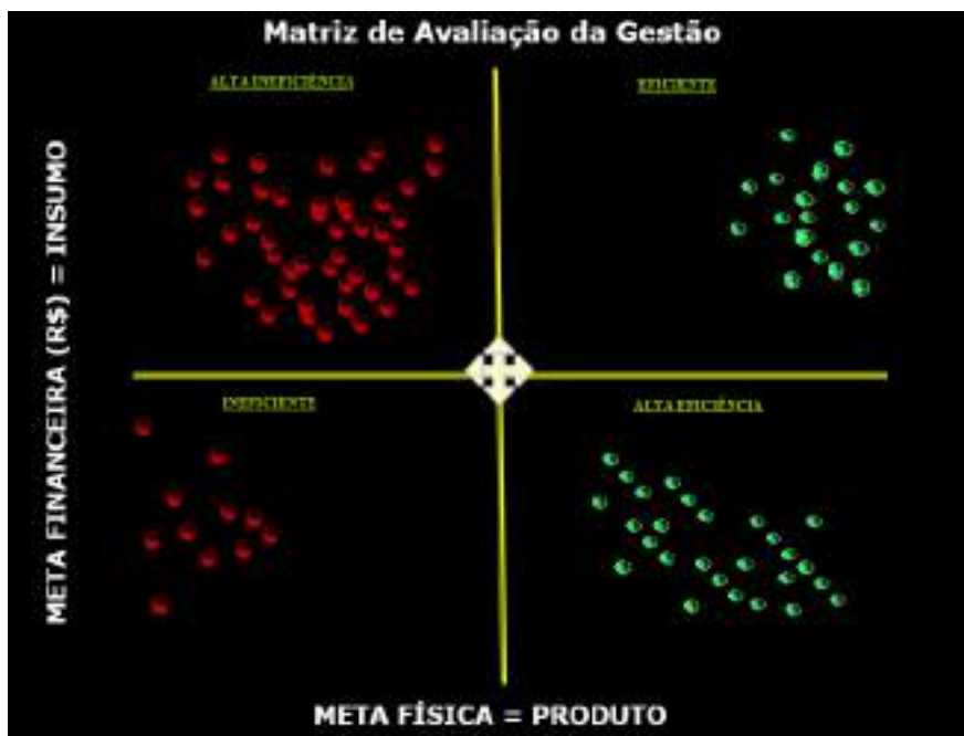
Figura 06: Matriz de Avaliação da Gestão com detalhamento de projeto atividades (ações/atividades)

A matriz de eficiência da gestão possui um vetor financeiro (eixo vertical) e um vetor associado a produtos/físicos (eixo horizontal), ambos são balizados por metas: Prevista e Realizada. O recorte percentual de aproveitamento se adequa a cronologia e ao ajuste percentual exigido para a classificação, com maior ou menor rigor.