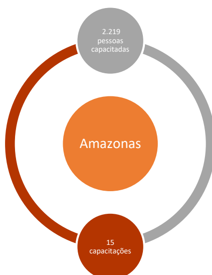
Figura 03. Número total de pessoas a serem capacitadas e número de capacitações no estado do Amazonas.