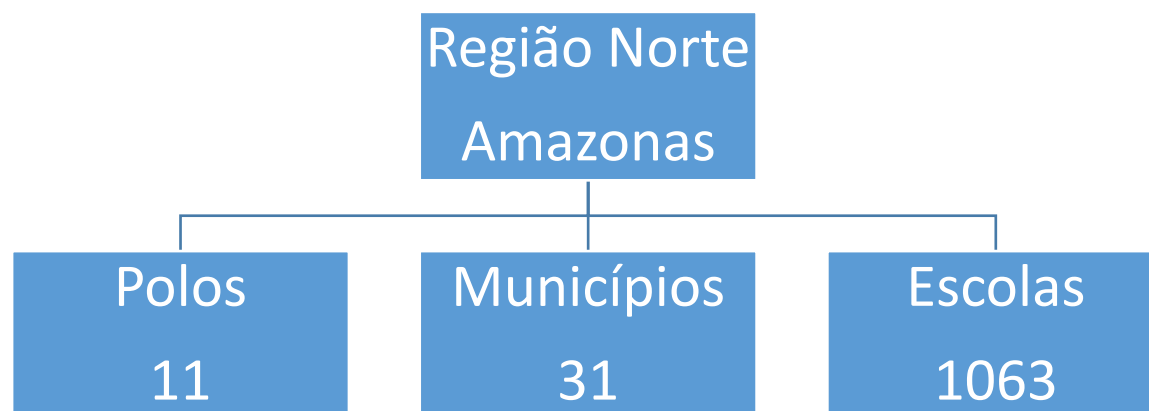
Figura 04. Número de Polos/municípios e quantidades de escolas que foram identificadas para as capacitações presenciais nos estados da Região Norte.

Observação importante: haverá uma etapa de validação pela CGAME/DIRAE/FNDE, que deverá ocorrer antes dos cursos serem realizados e disponibilizados ao público.