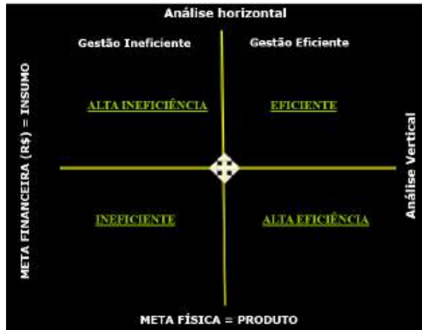
Figura 05: Matriz de Avaliação da Gestão de Programas Institucionais